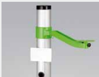
Aluminium kolom van BSA 437 analoge display