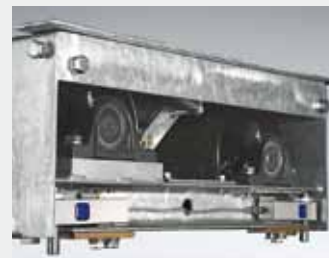
Asbelastingsweegschaal met vier sensoren