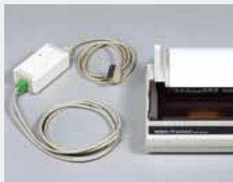
BNet-printerset met afstandsbediening