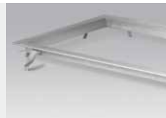
Randbescherming voor de nette montage van de rollensets