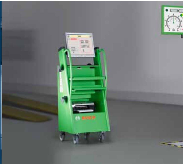
Voor alle remtesten: de teststraat van Bosch