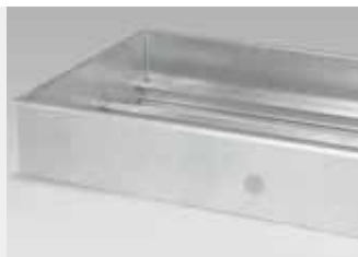
Inbouwframe voor de eenvoudige montage van de teststraat SDL 43xx