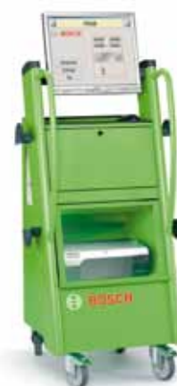
PC-rolwagen BSA 555