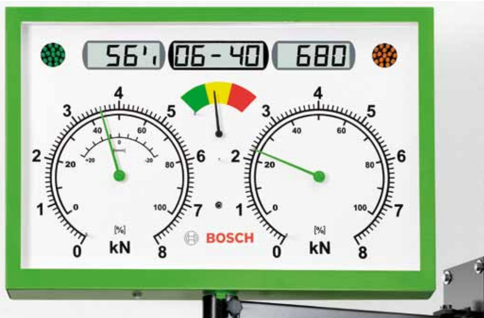
Analoge afleeseenheid van de BSA 43xx-reeks