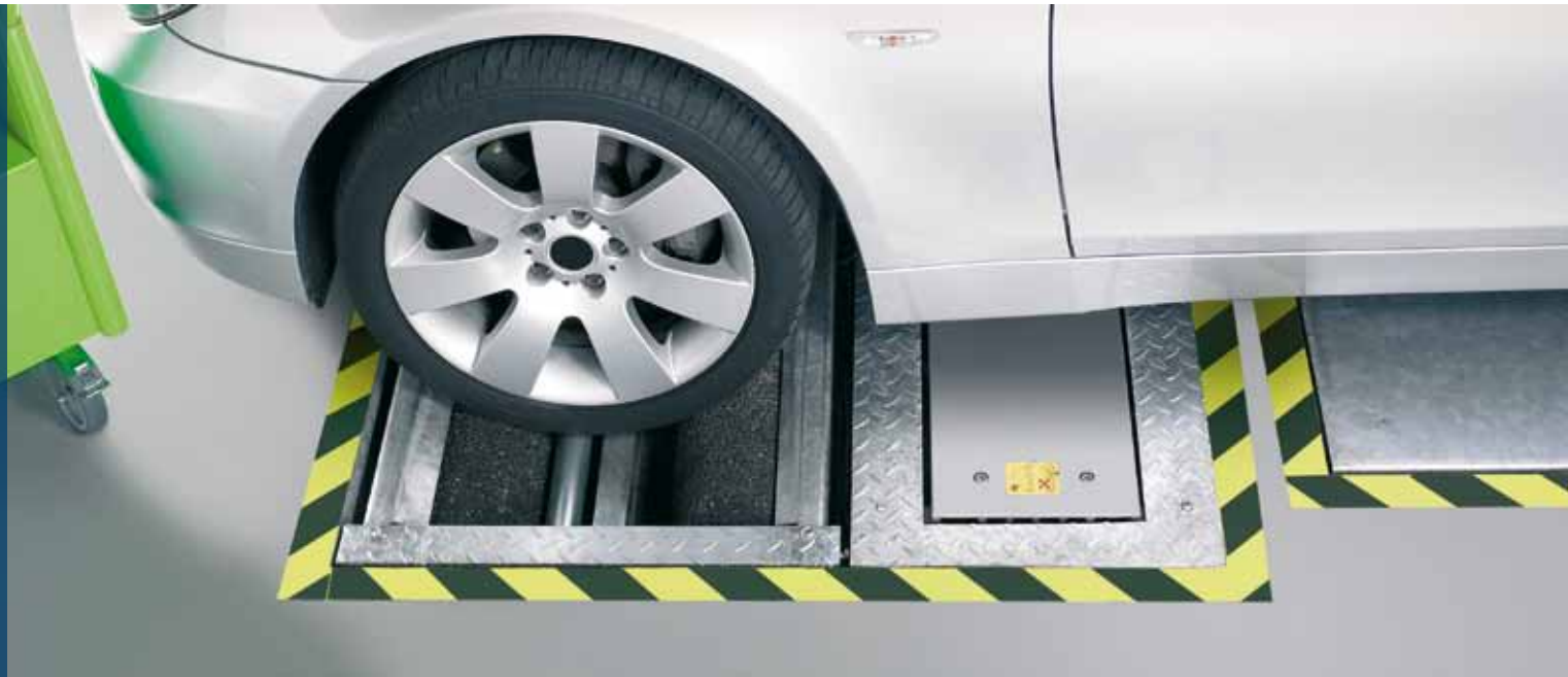
Compleet: teststraat SDL 43xx voor het testen en analyseren van het remsysteem van moderne personenwagens

Met de verschillende componenten van de SDL 43xx-reeks van Bosch kunnen remmentestbanken gemakkelijk tot een volledige teststraat worden uitgebreid. Zo kan bijvoorbeeld een SDL 415 zijslipplaat, een SDL 425 zijslipplaat met compensatieplaat, een SDL 430 ophangingstester of een SDL 435 ophangingstester met geluidsdiagnose worden ingebouwd.