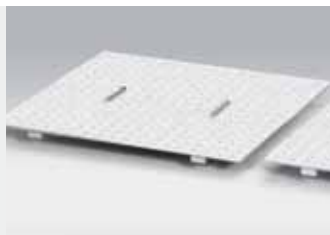
Afneembare afdekplaten voor de rollensets