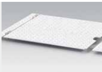
Scharnierende afdekplaten voor de rollensets