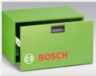
Kast voor het netjes opbergen van de printer