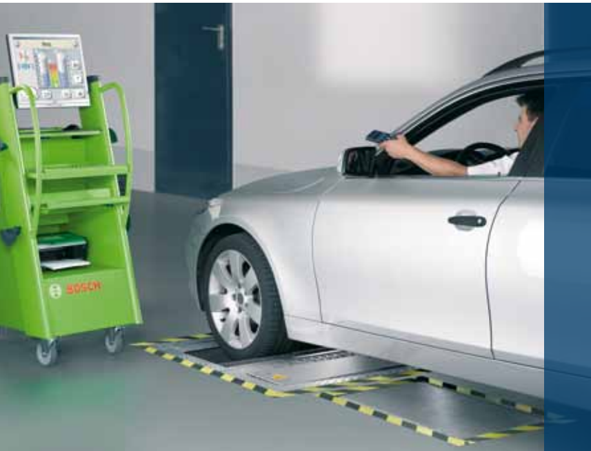
PC-rolwagen BSA 555 in combinatie met de rollenset